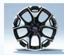
アルミホイール:17インチ(切削光輝)