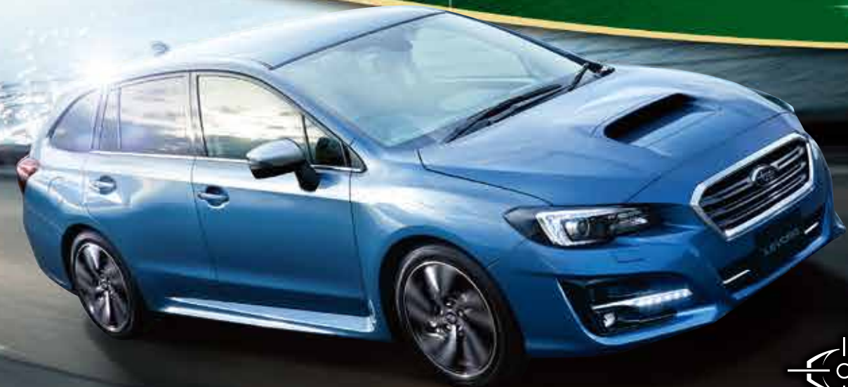
GT TOURER LEVORG

愛知県下 NO.1 スバルショップです。 平成28年 タイヤモンド賞受賞 愛知県 スバル車 販売販売台数1位